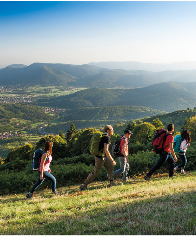
© INFRA - Massif des Vosges